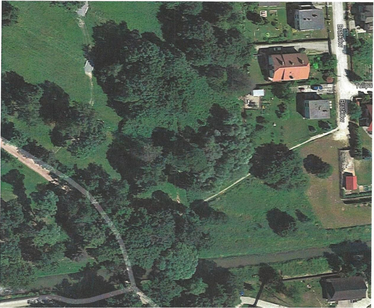
Istniejąca ścieżka na mapie Google