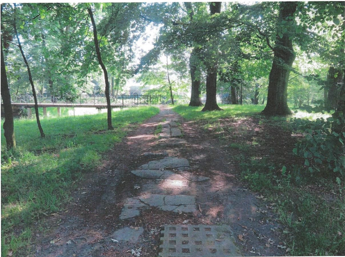
Zdjęcia istniejącej ścieżki: u góry -wylot z ul. Bratków; na dole- w pobliżu mostku na Pszczynce