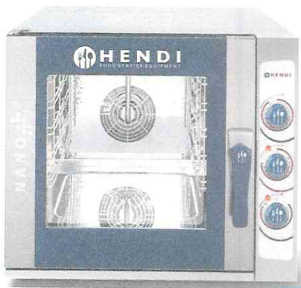
Piec konwekcyjno-parowy Hendi Nano 5x GN 2/3 CENA 6 517 zł